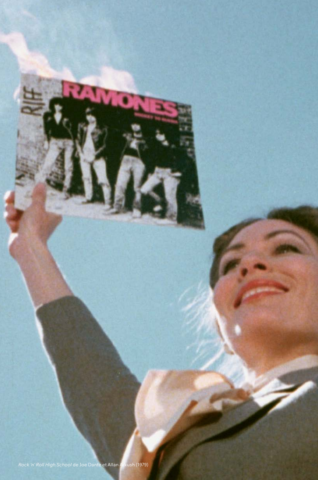
Rock 'n' Roll High School de Joe Dante et Allan Arkush (1979)