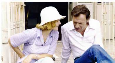
Immagine dal film

Venerdì 9 agosto alle ore 21.30 al PalaCinema 1 Repérages di Michel Soutter (1977) – DCP 4K F/d Presentato da Valérie Mairesse, Andrienne Soutter e Frédéric Maire