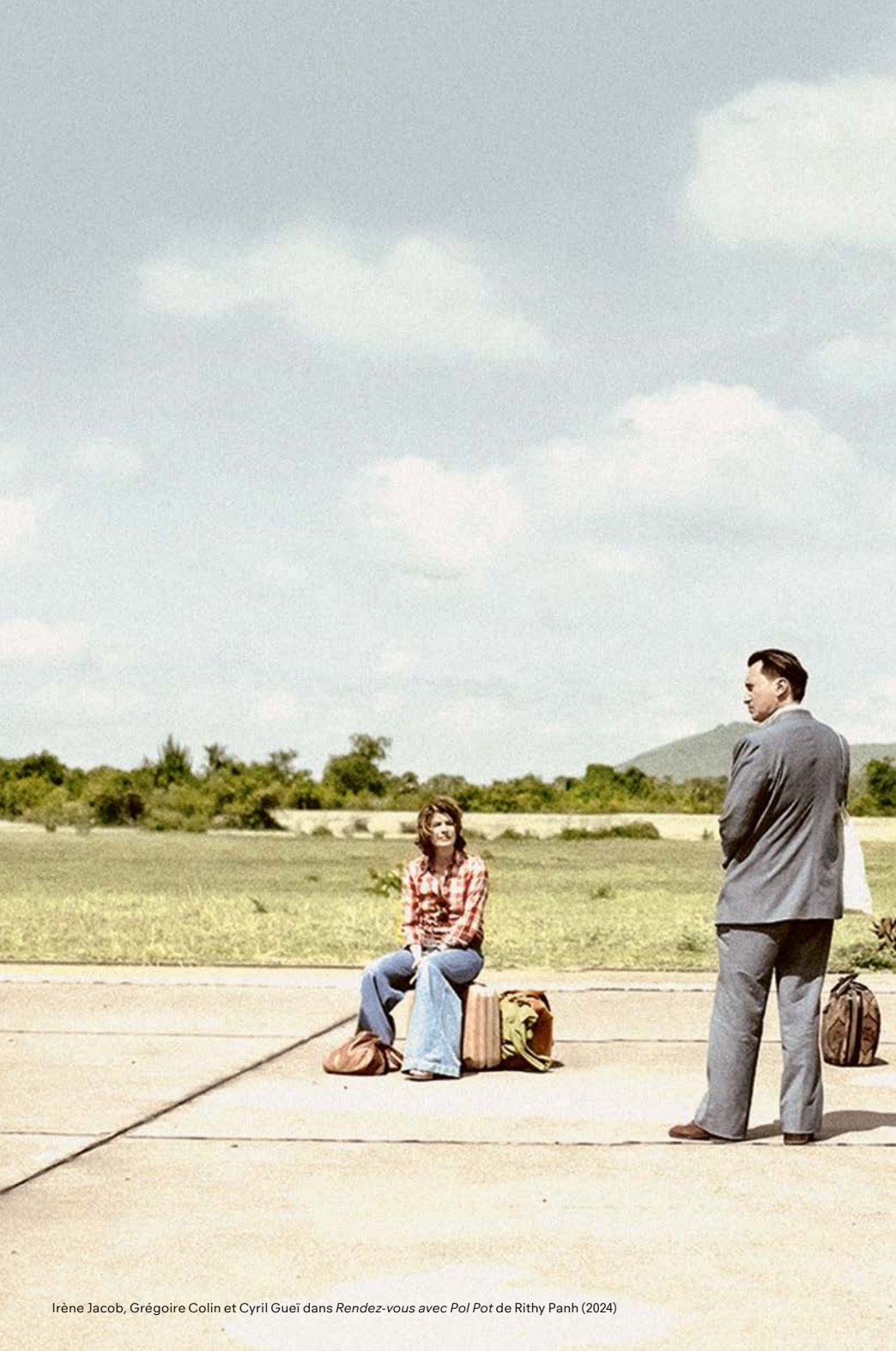
Irène Jacob, Grégoire Colin et Cyril Gueï dans Rendez-vous avec Pol Pot de Rithy Panh (2024)