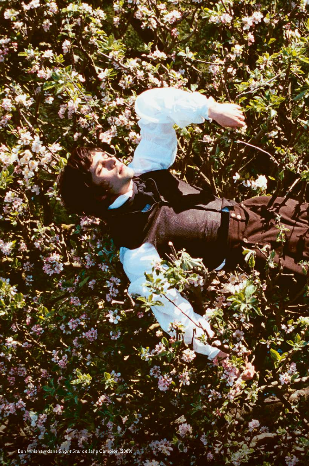
Ben Whishaw dans Bright Star de Jane Campion (2009)