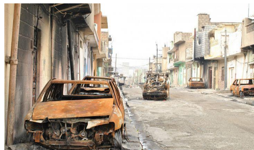
Une rue irakienne