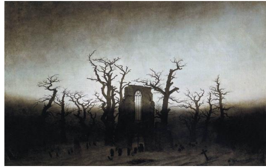
"L'abbaye dans la forêt" de Caspar David Friedrich

Du matériel supplémentaire (séquences ou powerpoint) peut être demandé à frank.dayen@vd.educanet2.ch