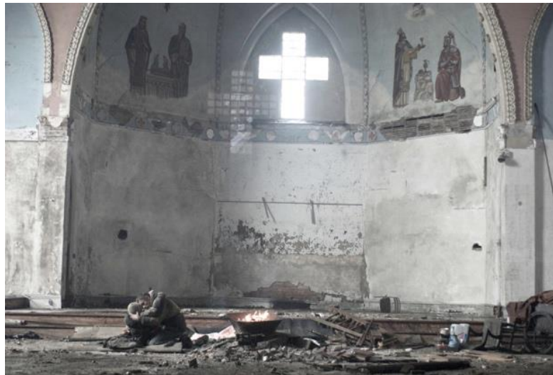
Pietà façon The Road